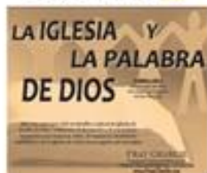
La Iglesia y la Palabra de Dios (8)