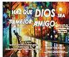
Haz que Dios Sea tu Mejor Amigo (9)