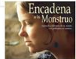
Encadena a tu Monstruo (9)