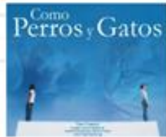
Como Perros y Gatos (9)