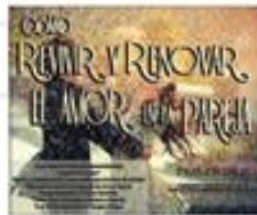
Cómo Revivir y Renovar el Amor en la Pareja (9)