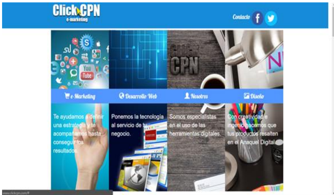
Figura 1. Página de la empresa ClickCPN

Después se le pidió al estudiante crear una página para la empresa ClickCPN (figura 1), donde se tenía la opción de utilizar cualquier lenguaje mientras se cumplieran los requerimientos: Se ocupaba que la página mostrara información acerca de los servicios que ofrecían, mostrar algunas imágenes, redes sociales y una sección de contacto con un mapa de Google Maps (figura 2).