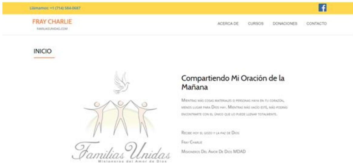
Figura 4. Página de FrayCharlie.com

Para el siguiente proyecto (figura 4) se recibió a un cliente en la oficina, esto con el fin de tener un acercamiento con una empresa y que el estudiante pudiera dar una opinión como experto en informática.