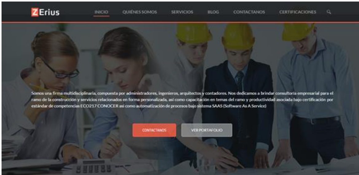
Figura 7. Página para Builder Collins

Para este proyecto se escogió una plantilla de Wordpress y se cargó con la información que la empresa proporcionó, quedando todas esas secciones de la imagen anterior. Uno de los requerimientos era el de tener una sección de Blog para publicar noticias o información que ellos consideraran importante para sus clientes.