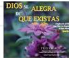
Dios se Alegra de que Existas (9)