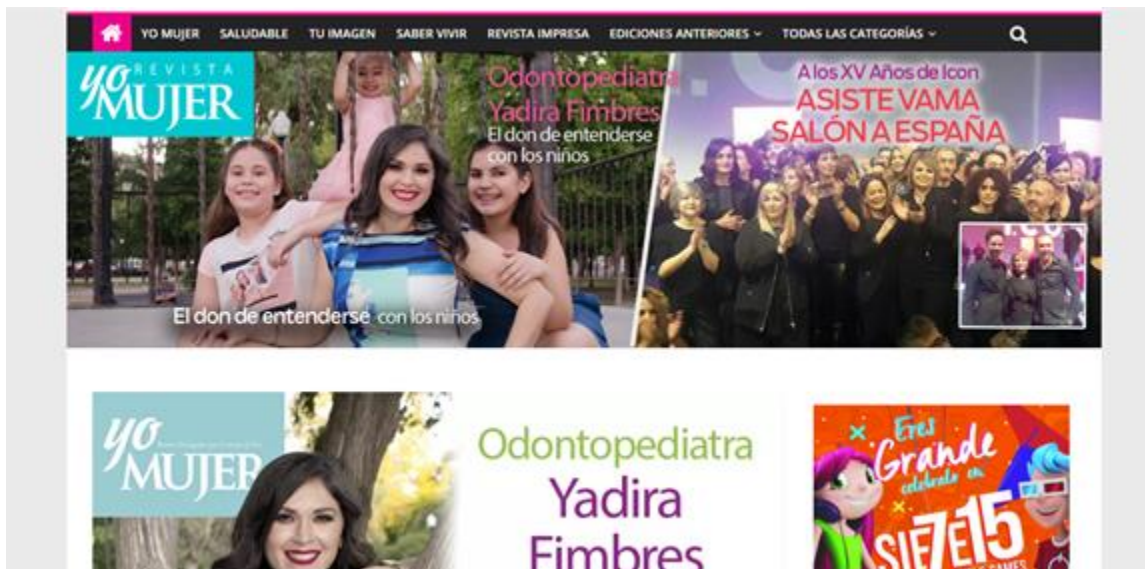
Figura 8. Página de YoMujer.com

Otra página que se hizo como parte del proyecto fue la página de la revista Yo Mujer (figura 8). Esta es una revista sin costo que se imprime mensualmente.