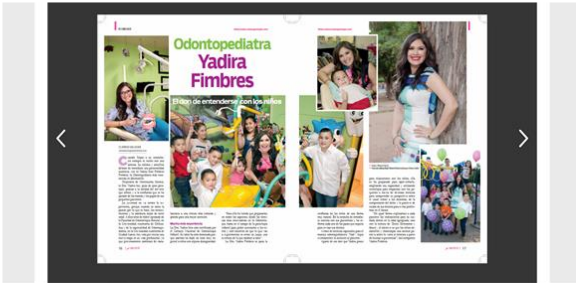
Figura 9. Sección Revista Impresa para YoMujer.com

Otro requisito fue crear la sección de “Revista Impresa”, donde se pudiera visualizar la revista física pero en un formato digital, y para esto se utilizó un Plugin de Issuu , que permite ver documentos de PDF en forma de libros digitales (figura 9).