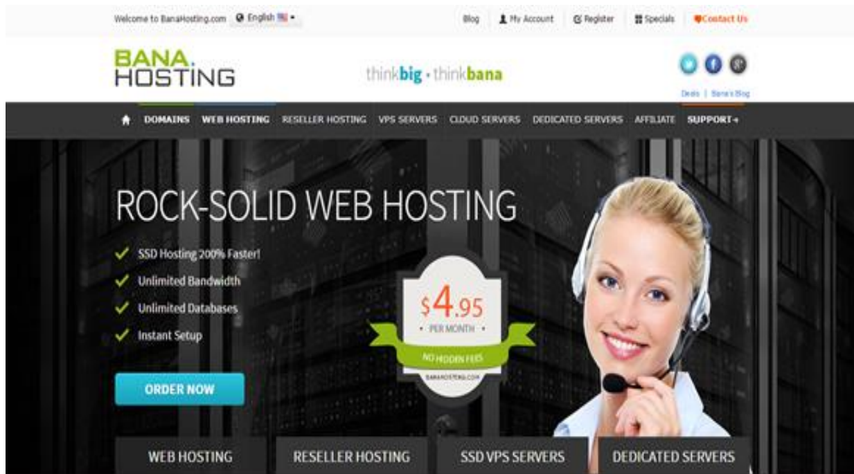
Figura 3. Página BannaHosting.com

Una vez aprobada la página de la empresa, el encargado de proyecto comentó que se tenían algunos otros clientes con los cuales se podría seguir practicando para reforzar más la experiencia del practicante en un ambiente profesional. También se tendría la oportunidad de experimentar directamente con los clientes en reuniones y en la toma de requerimientos de una página.