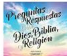
Preguntas y Respuestas (8)